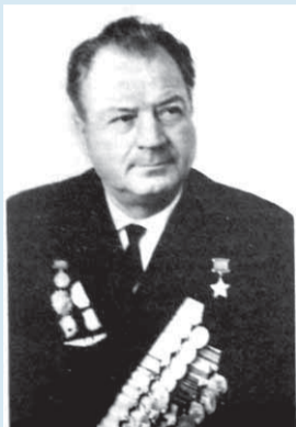
Герой Советского Союза