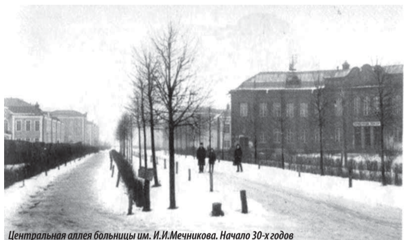
Центральная аллея больницы им. И.И.Мечникова. Начало 30-х годов