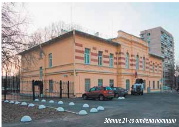
Здание 21-го отдела полиции

Уважаемые жители МО Пискаревка. Информирем вас о том, что с 1 февраля 2015 года в связи с реорганизацией территориальных органов полиции был сокращен 62-й отдел УМВД Калининского района. Пока ведутся организационно-штатные мероприятия, по всем вопросам вы можете обращаться в 3-й и 21-й отделы полиции. А также по телефону справочной службы: 573-06-60 .